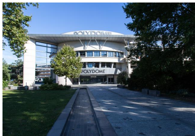
Parc Exposition Grande Halle d'Auvergne